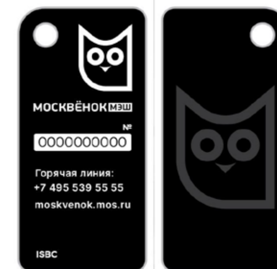
Рисунок 14. Изображение брелок «Москвёнок».

Проверка электронных идентификаторов осуществлена отделом сопровождения проектов с использованием электронных карт в образовании.