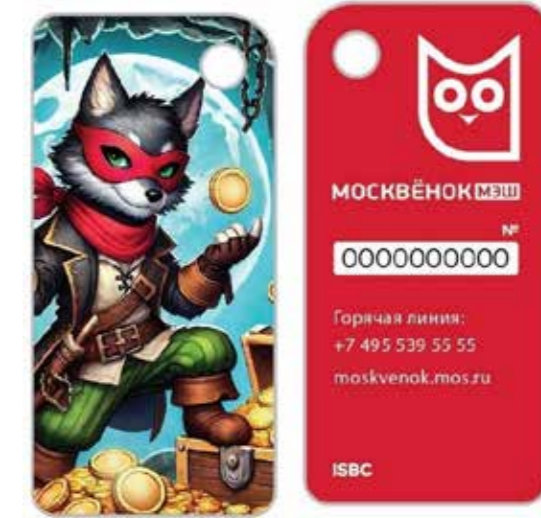
Рисунок 1. Изображение брелок «Москвёнок».

Проверка электронного идентификатора осуществлена отделом сопровождения проектов с использованием электронных карт в образовании.